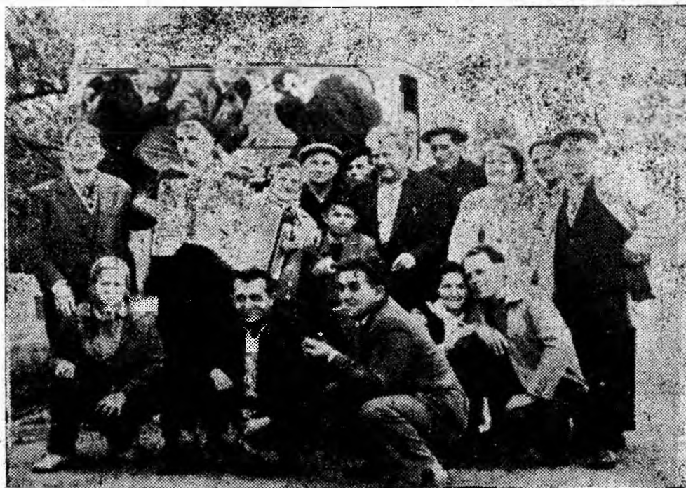
Un grup de preparatori de la Lupeni în excursie la Geoagiu