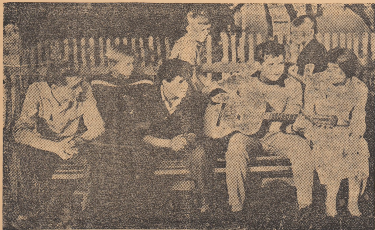
Iată un mînușchi de tineri, pe o bancă în parc. Bucuria vieții noi se oglindește pe fețele lor tinere. El fredonează, în acompaniament de chitară, un cîntec, poate chiar despre tinerete...

Tirziu, glasurile voloase ale elevilor au început să răsună din nou. Voloși, bine dispuși, se reîntorceau cu toții în tabără.