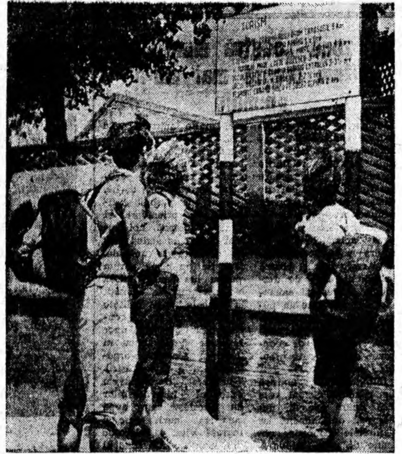
La început de drumetie...

Pentru ca și tinerii din aceste unități să fie atrași la asemenea acțiuni, ar fi util ca organizațiile U.T.M. din aceste unități să acționeze în comun pentru organizarea de excursii, întâlniri sportive, ieșiri în aer liber etc. Se poate veni, de asemenea, în ajutorul organizațiilor U.T.M. din unitățile mici prin aceea că tinerii din aceste unități să participe la acțiunile inițiate de întreprinderile mari pentru organizarea timpului liber al tinerilor. În felul acesta un număr mai mare de tineri din unitățile mai mici vor putea să-și petreacă timpul liber în mod plăcut.