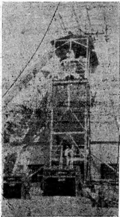
Construcția industrială din clișeu a fost de curînd terminată de I.C.M.M. la mina Dilja. Este turnul metalic al puțului auxiliar nr. 1 care împreună cu instalațiile anexe vor servi la săparea acestui puț după metoda modernă de lucru cu cofraj glisant și pod mobil.

Cu acest prilej se va prezenta piesa „Generalul și nebunul”, o izbită comedie a lui Angelo Wagenstein. Piesa se bucură de o distribuție adecvată.