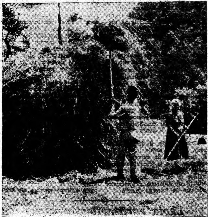
IN CLIȘEU: La strânsul stințel în comuna Bănița.

Hotărârile Consiliului de Miniștri ne-au mobilizat în muncă. Muncind mai bine, folosind mai bine posibilitățile de creștere și îngrășare a unui număr sporit de animale, vom putea contracta cu sta-