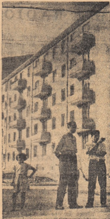
Blocul B cu 30 apartamente, unul din frumoasele blocuri ridicate în ultimul timp la Petrila.