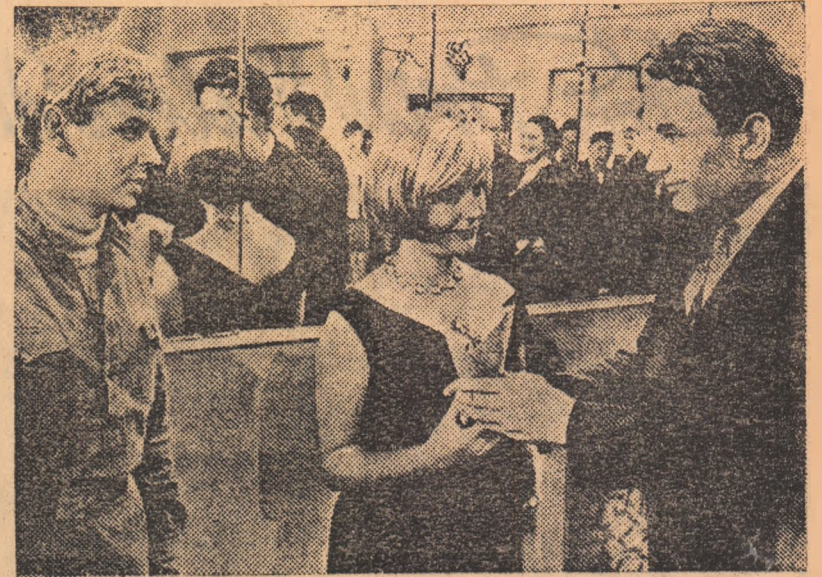
ÎN CLIȘEU: O secvență din filmul „Avîntul tinereții”.

lui față de cei din jur, prin poziția pe care o ia în diferite situații în care e pus, Babușkin dovedește că aparține generației tinerilor constructori ai comunismului, căreia nu-i este străin nimic din ceea ce se petrece în jurul său.