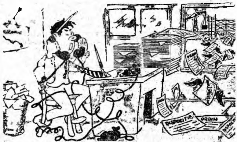
— Nu pot, mi-e imposibil să mă deplasez pe șantier. Sînt „prins” aici de-o sumedenie de treburi!..

PETROȘANI — 7 NOIEMBRIE: Doi din alte lumi; REPUBLICA: Dragoste și pălăvrăgeli. (Responsabilitatea cinematografelelor din Petrila, Lonea, Livezeni, Iscroni, Petroșani, Vulcan, Lupeni, Bărbăteni și Uricani nu au trimis programarea filmelor pe luna octombrie).