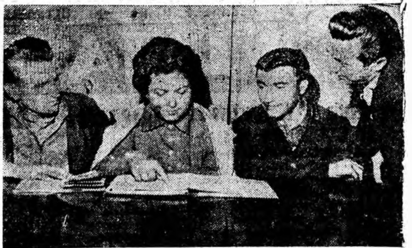
Cum muncesc, cum învață tinerii din secție. Iată o întrebare care este des discutată în biroul organizației U.T.M. din secția administrativă de la U.R.U.M.P.

Perfecționarea continuă a procesului instructiv-educativ, lichidarea mediocrității, întărirea disciplinei, dezvoltarea la elevi a trăsăturilor omului de tip nou, impune îmbunătățirea activității pe tărîm profesional și obștesc a fiecărui cadru didactic. Acest lucru trebuie să preocupe în mod deosebit pe viitorul birou al organizației de bază. Este necesar ca biroul organizației de bază, toți comunistii să militeze pentru menținerea, în continuu, a unei atmosfere sănătoase, de muncă, combative și intransigente față de neajunsuri, față de actele de indisciplină, pentru dezvoltarea răspunderii și a spiritului de inițiativă a cadrelor didactice.