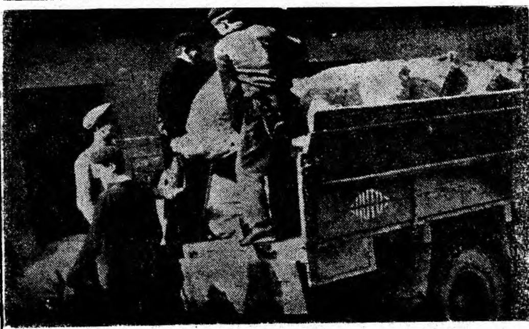
În depozitele O.L.F. sosesc zi de zi cantități tot mai însemnate de legume și fructe pentru iarnă. De aici produsele sînt transportate spre unitățile de deservire. IN CLISEU: La depozitul O.L.F. din Petroșani se încarcă un nou transport de car-

Comitetul executiv al Sfatului popular orășenesc Petroșani consideră că prin măsurile luate pînă în prezent și prin stricta lor aplicare va reuși să asigure aprovizionarea populației în sezonul de iarnă 1963—1964.