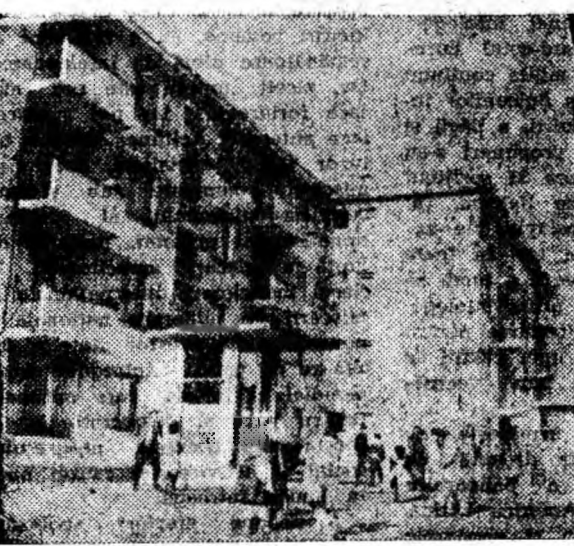
...iar locatarii de la blocul nr. 33 au știut să fie și ei prezenți.

Duminică dimineața. Soarele abia a răsărit. În noul cartier Livezeni, acolo unde numai în ultimile luni s-au dat în folosință sute de apartamente, domnește o viață animată. Oameni de vîrstă și ocupații diferite au venit înarmați cu lopăți, târnăcoape, hîrlețe. Sînt muncitori de la I.C.O., I.C.R.T.L., I.L.L., „6 August”, de la U.R.U.M.P., elevi, gospodine, funcționari, pensionarii. Veniți să lucreze la cu asalt ultimele grămăzi de moloz, să niveleze terenul din jurul blocurilor. Mulți — dar nu toți — dintre locatarii au ieșit să participe la munca de infrumusețare. Că doar nu o privească pe geam cum lucrează „voluntarii” veniți din oraș. Basculanțele sînt încărcate cu hâte din palme. Păcat că nu sînt mai multe. În multe locuri distingîți tineri în uniforme albastre. Sînt elevii Școlii profesionale de ucenici din Petroșani. Au venit peste 300 de la mai toate clasele: I C, I B, I H, II A, II D, II E, II G. Cel mai mulți au venit însă din clasa I F.