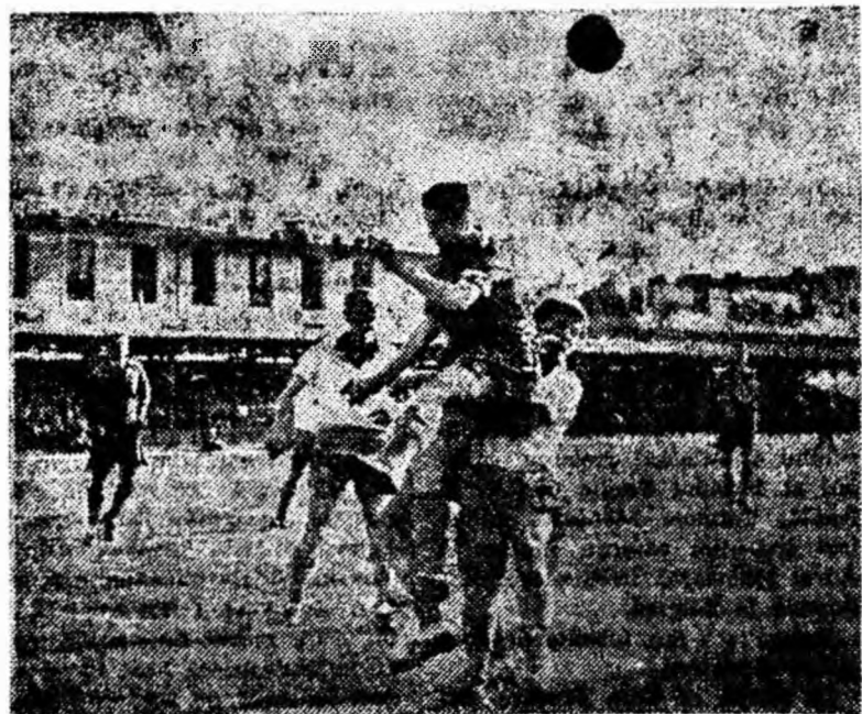
Cortina s-a lăsat peste primul act al campionatului categoriei B la fotbal. Fazele frumoase vor rămâne pentru multă vreme în amintirea spectatorilor și unele din ele immortalizate pe peliculă. După cum se vede în clișeu, saltul aerian al jucătorului, după balon, se asemănă foarte mult cu acrobația sau baletul.