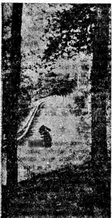
A început să fulgăie, iubitorii plimbărilor cu motocicletă au cam luat... vacanță. Totuși, după cum se vede și din clișeu, cîte unul mai temerar se aventurează pe șosele...

PETROȘANI — 7 NOIEMBRIE: A dispărut o navă; REPUBLICA: O perle de mamă; Misterul celor doi domni „N”; LIVEZENI: Omul cu două fețe; LUPENI: Pompietul atomic; BĂRBĂTENI: Albă ca zăpada; URICANI: Clubul cavalerilor.