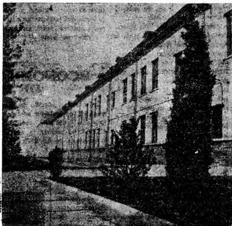
Aspect exterior al I.M.P.