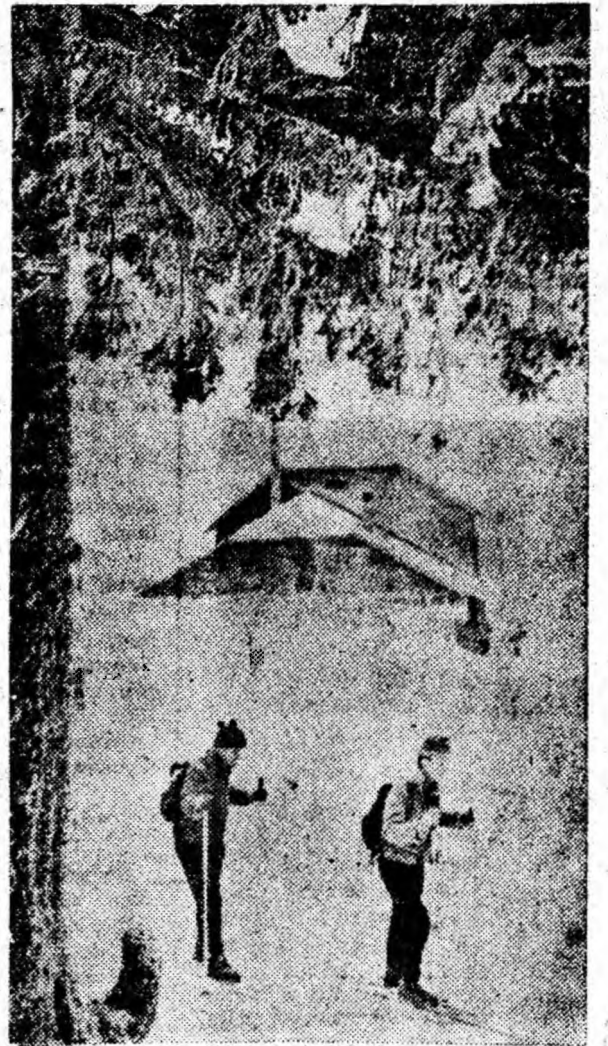
Urcușul spre înălțimile înzăpezite nu este ușor. Dar odată ajuns sus, frumoasele priveliști încîntă ochiul. Privești minunata panoramă din jur, apoi o pornești cu schiurile pe pîrtie.

Totul era în deplină ordine la această cabană, care ar merita pe deplin denumirea de hotel turistic, în cadrul acestui complex sportiv format dintr-o pîrtie de coborîre, o pîrtie de slalom uriaș,