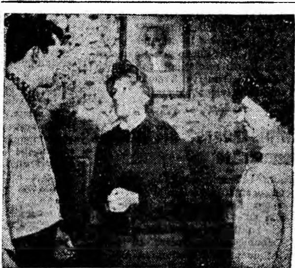
Formația de teatru a cooperativei „Sprînjul minier” din Lupeni pregătește o nouă piesă în vederea celui de-al VII-lea concurs al formațiilor de artiști amatori.

PETROȘANI — 7 NOIEMBRIE: Uchișul și fata; REPUBLICA: A-gatha, lasă-te de crime; PETRILA: Comedianții; LONEA: Concertul mult visat; LIVEZENI: Lupii la stîna; ANINOASA: Cursa de 100 km.; LUPENI: Camelia; BĂRBĂTENI: Perle negre; URICANI: Floarea de fier.