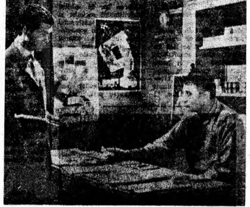
IN CLISEU: O secvență din film.

Filmul „Pisica de mare” a producție a studioului cinematografic București, este un film de aventuri a cărui acțiune demască unele activități imperiale de spionaj împotriva statului nostru. Plănuiind să pună mâna pe unele intrate în posesia planurilor. Fotografiile lor urmează să fie preluate prin Livia Gregorian unui spion care sosește în acest scop în țara noastră. Acest spion cade în mâinile securității. Substituindu-se spionului, căpitanul de secu-