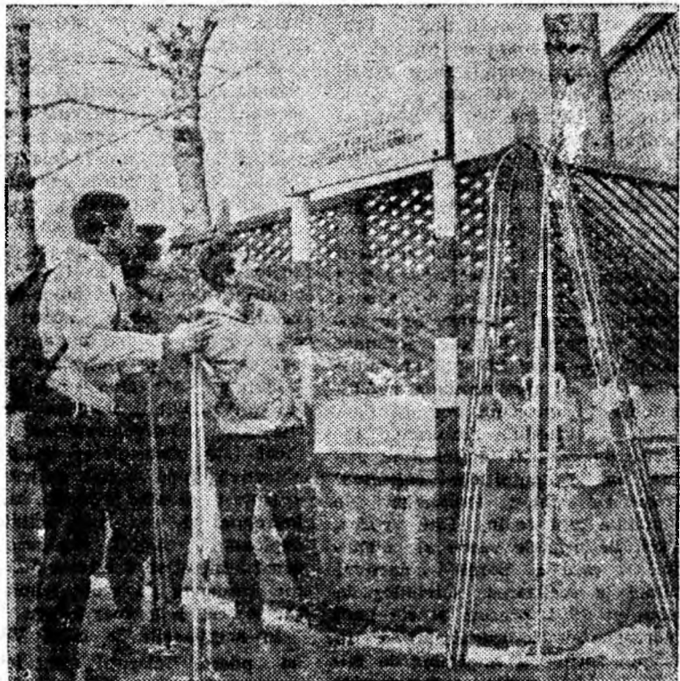
Popas la tabela indicatoare și apoi la drum spre pîrțile de la Paring.