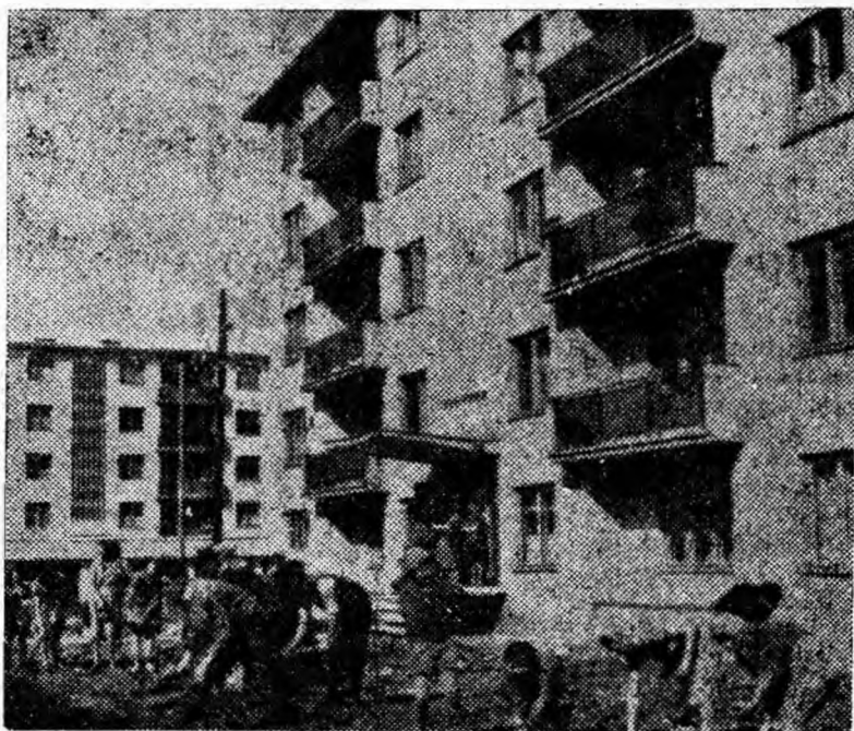
Toaleta de primăvară a orașului... Fotoreporterul nostru a surprins locatarii blocului V din Vulcan lucrînd la amenajarea zonelor verzi în jurul blocului.

Muncitorii, tehnicienii și inginerii de la U.R.U.M.P. muncesc cu însuflețire pentru traducerea în viață a angajamentelor luate în cinstea celei de-a XX-a aniversări a eliberării patriei. În acest scop în fiecare secție au fost luate măsuri pentru extinderea procedurilor avansate de lucru și a experienței înaintate. Toate acestea au condus la obținerea unor realizări de seamă. Astfel, în primul trimestru al anului planul producției globale pe uzină a fost depășit cu 3,27 la sută, iar planul la producția marfă a fost realizat în proporție de 110,6 la sută. În același timp, productivitatea muncii obținută întrece pe cea planificată cu 2,5 la sută. În perioada respectivă au fost confecționate peste plan 150 tone de construcții metalice, 16 tone utilaje, 180 tone de armături metalice, iar planul la oțel lichid a fost depășit cu 49 tone.