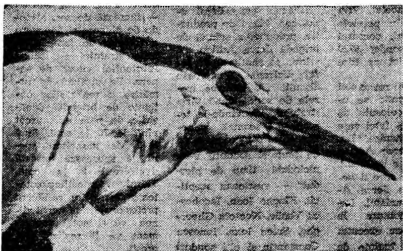
Rătăcînt pe meleagurile noastre, pescărușul a (întinut să lase fotografia din clișeu drept amintire.

NICOLAE PLUGARU corespondentul Agerpres pentru regiunea Bacău