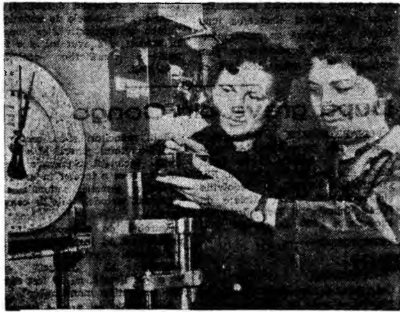
Laboratorul mecanic al U.R.U.M. Petroșani. Aici se fac încercări mecanice în vederea determinării rezistenței la cablurile pușturilor de extracție, atât de la minele din Valea Jiului cit și din țară.

Acțiunea s-a încheiat. Locutorii din raza de activitate a organizației de bază cartier 3 au adunat și predat la I.C.M. 5600 kg. fier vechi. Organizația de bază din cartier e hotărîită să mai organizeze asemenea acțiuni. Locatarii le primesc doar cu multă bucurie.