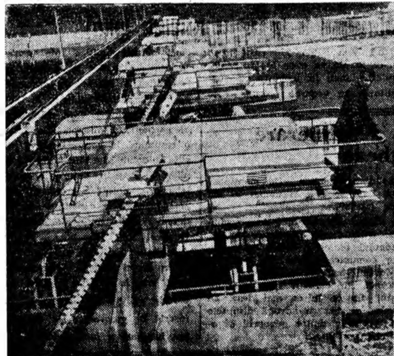
Instalațiile barajului termocentralei Paroșeni prin care se asigură alimentarea cu apă din Jiu a uzinei.

Vă informăm însă că imediat ce timpul a permis, lucrările au fost atacate și s-a dat dispoziție grupului de șantier nr. 2 Petroșani ca acestea să fie complet terminate”.