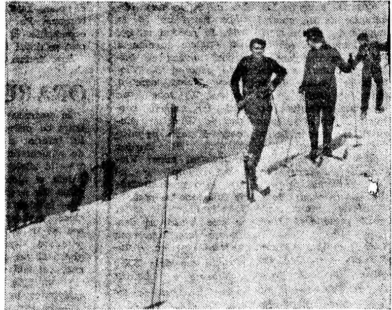
Fotografia nu a fost realizată astăzi iarnă, ci de curind. Sub mingiile soarelui de primăvară e parcă și mai plăcut să schiezi.