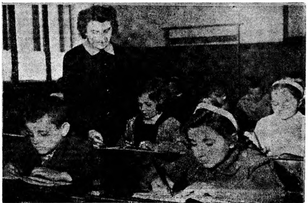
„După aproape un an școlar, literele alfabetului nu mai constituie un secret pentru noi” — par să spună chipurile elevilor din clasa a I-a. „Acum cu toții scriem și citim ca la... carte”.

Editura pregătește, de asemenea, 215 titluri, în aproximativ 500 000 exemplare de cursuri și manuale necesare studenților din învățămîntul superior.