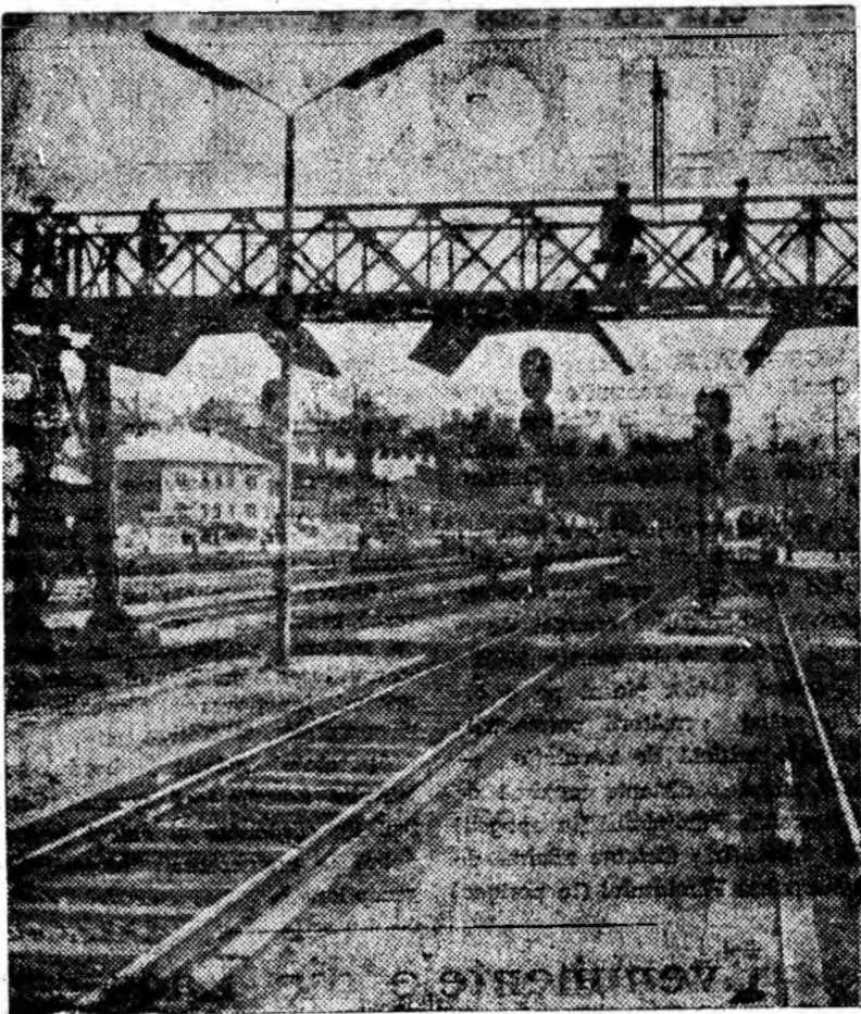
La intrarea în gara Petroșani.