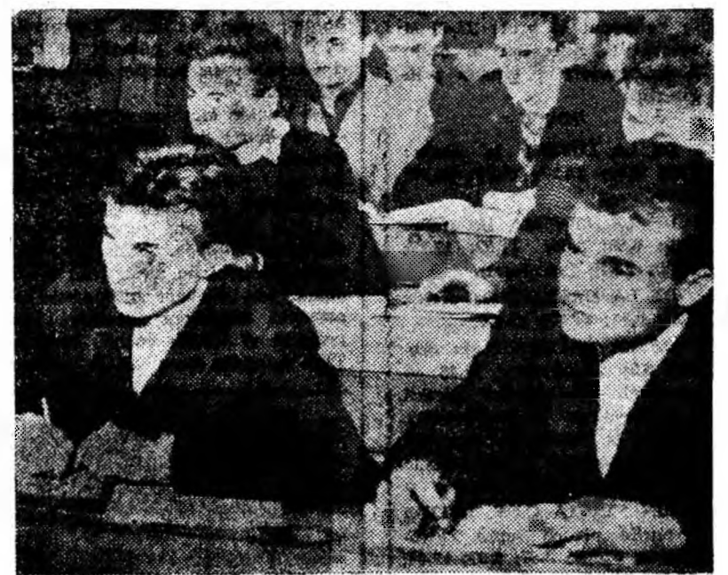
ÎN CLISEU: Elevii din clase a XI-a A a Școlii medii serale din Petroșani — în timpul unei ore de recapitulare. Cu atenția încordată ei ascultă explicațiile profesorului.