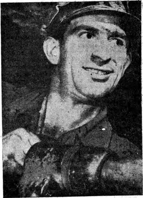
Minerul Hamz Aurel în lupta corp la corp cu stincile subterane. Brigada lui deschide zona estică a cimpului minier de la cea mai tânără mină — Paroseni.

Organ al Comitetului orășenesc P.M.R. Petroșani și al Sfatului popular orășenesc