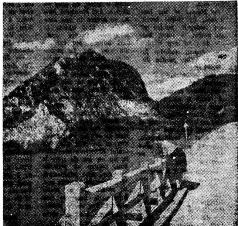
Vedere spre masivul calcaros, în iornă de con, din localitatea Peștera Boli.