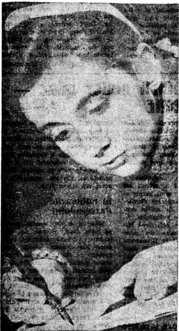
În plin efort de creație.