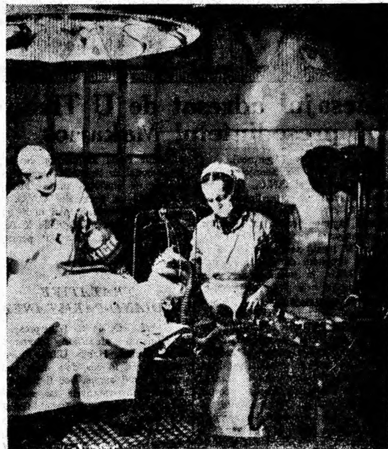
Spitalul unificat Petroșani: în sala de operații, dotată cu aparatajele necesare, se fac pregătiri pentru o nouă intervenție chirurgicală.