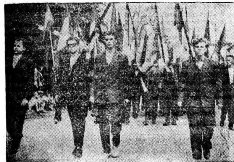
Defilează oamenii muncii din Petrița.