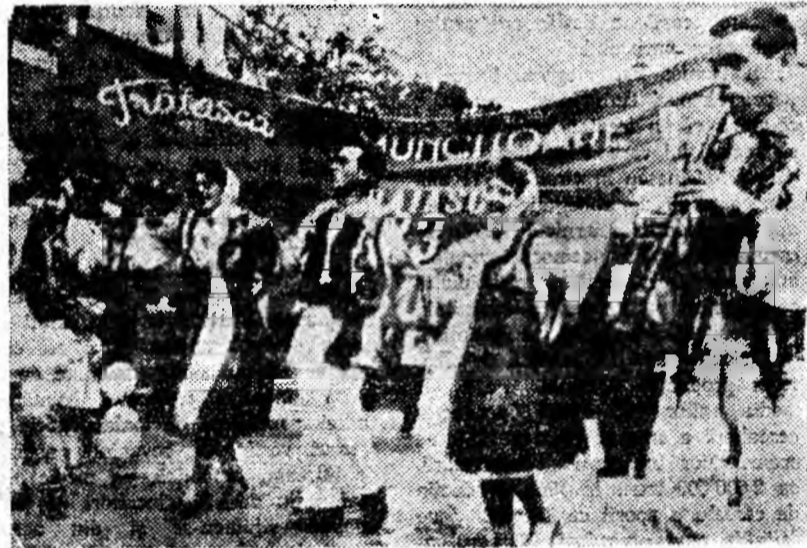
Formația artistică a clubului muncitoresc din Petrila executînd în fața tribunei un frumos dans popular.

lectivul de la I.L.L. raportează partidului: în primele 7 luni ale anului sarcinile de plan au fost îndeplinite la toți indicatorii.