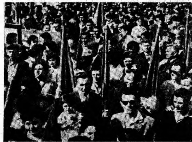
În Piața Victoriei, coloanele sînt pregătite pentru demonstrație.