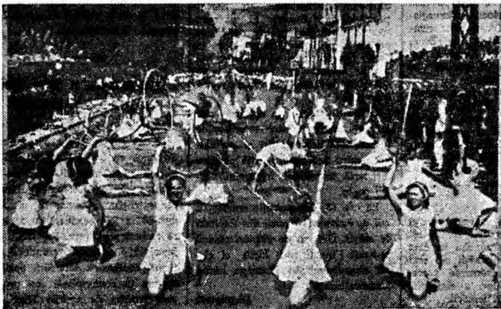
Tinerețe, grație, frumusețe.

Totul a încîntat ochiul și inima, totul a dat marile sărbători un colorit viu și încîntător.