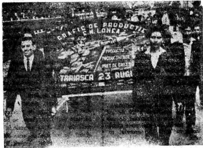
Trece coloana minerilor de la Lonea.