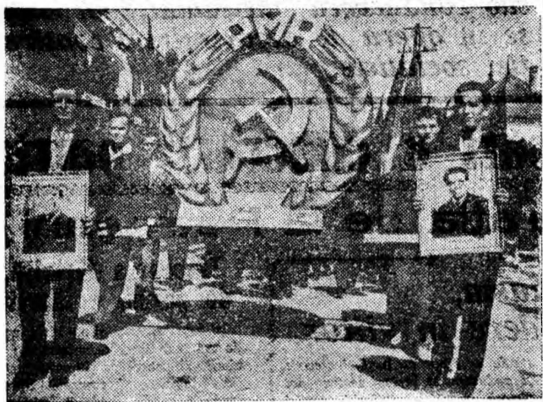
Minerilor aninoseni poartă portretele fruntașilor.