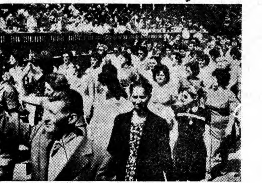
Prin fața tribunei trec coloane compacte de manifestați.