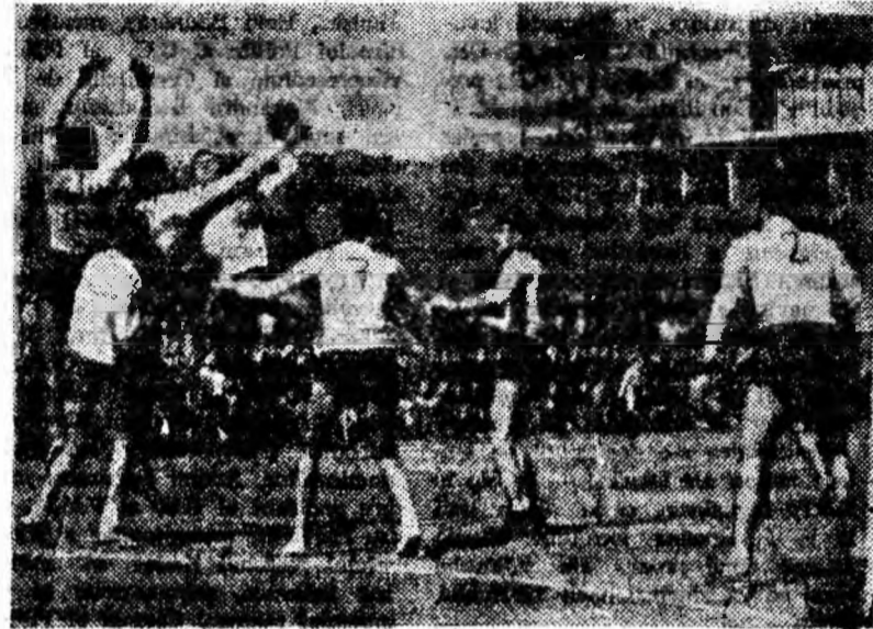
IN CLIȘEU: O fază din întâlnire.