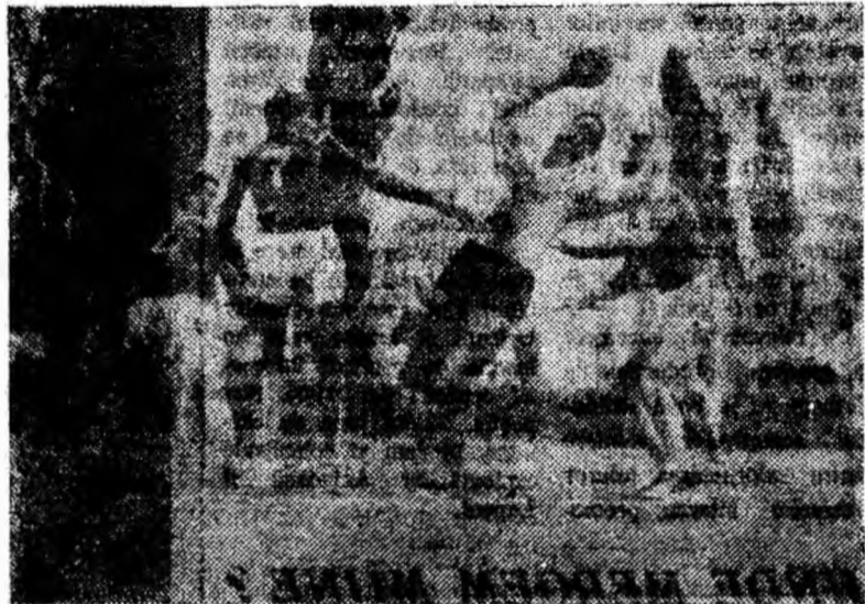
IN CLIȘEU: Atac dinamovist la poarta gazdelor.

mătoarele trei minute, studenții mai înscriu de două ori majorînd scorul la 6-2. Se părea că victoria nu le mai poate scăpa. Iată însă că oaspeții își revin puternic și de astădată supun unui tir puternic poarta aparată de Florea. „Zestrea” de goluri, agonisită cu trudă aproape douăzeci de minute scade mereu. Din minutul 23 și pînă la sfîrșitul reprizei oaspeții înscriu 5 goluri fără