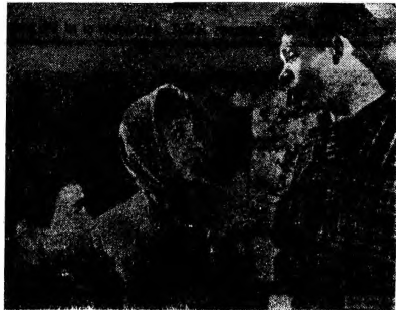
IN CINEȘTE: Un cadru din filmul „Popasul”.

nematograful „7 Noiembrie” va rula începînd de mîine filmul sovietic „Popasul”.