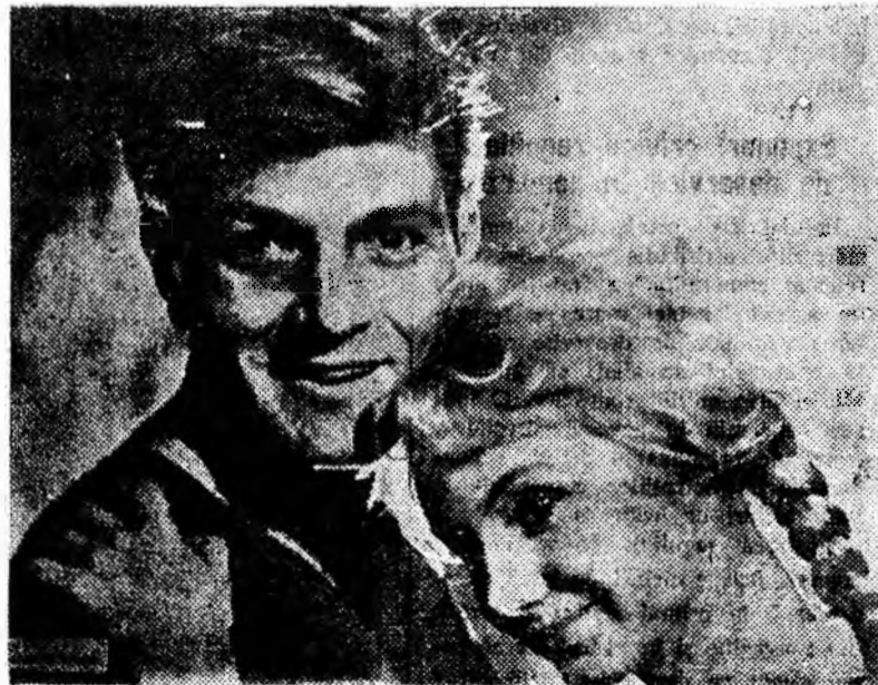
O secvență din filmul „Fata din casa roșie”

În rolurile principale: Sophia Loren (Chatherine — Madame Sans-Gené), Julien Bertheau (Napoleon), Robert Hossein (Lefebvre), Marina Berti (Elisa Bonaparte) etc.