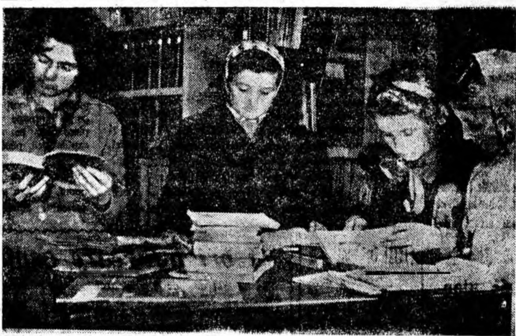
La biblioteca clubului muncitoresc din Petrila.

Astăzi la ora 10, la clubul Cooperativei meșteșugărești „Jiul” din Petroșani, va avea loc un concurs „Cine știe, câștigă” pe marginea cunoașterii legilor interne de funcționare a cooperativei.