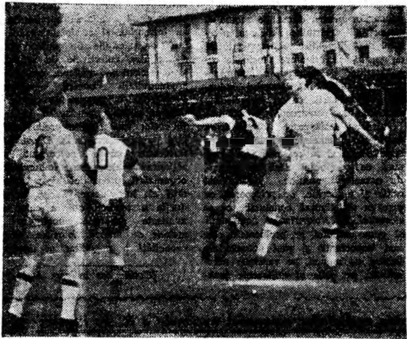
Duelurile aeriene pentru balon sînt mult gustate de iubitorii fotbalului. Faza din clișeu a fost immortalizată pe peliculă la meciul Jiul — Clujeana, meci câștigat de gazde cu 3-0.