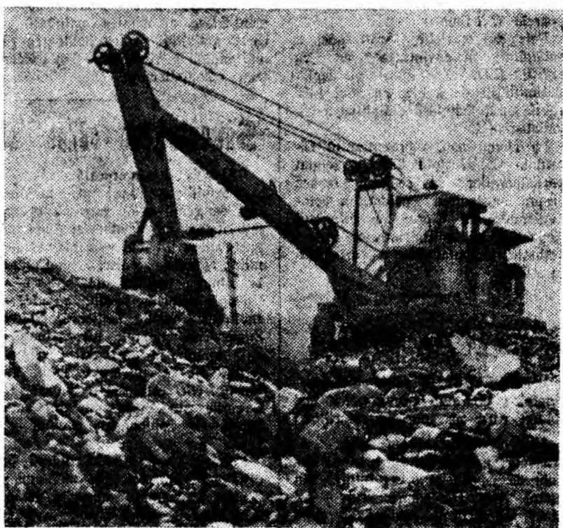
Mașinile puternice îi ajută pe oameni. Excavatorul din fotografie aparținînd S.T.R.A. lucrează la corectarea abiei Jiețului.

Anii au trecut. Aluviunile apelor cît și zgura aruncată peste stivele de fier au ascuns o bună parte din instalații. La redeschiderea minei