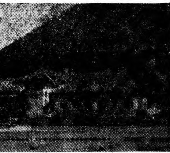
Poiana Brașov este cea mai mare bază sportivă de iarnă din țara noastră. Pîrtiile de schi, pitorescul locurilor atrag ca un magnet. Impunătorul hotel turistic de aici este însă gazdă prietenoasă în toate anotimpurile.

La șantierul Livezeni stau neastupate de circa 4 luni niște șanturi săpate de I.L.L. pentru gășirea unui defect la rețeaua termică și pe care atîț I.L.L. cît și șantierul refuză să le astupe.