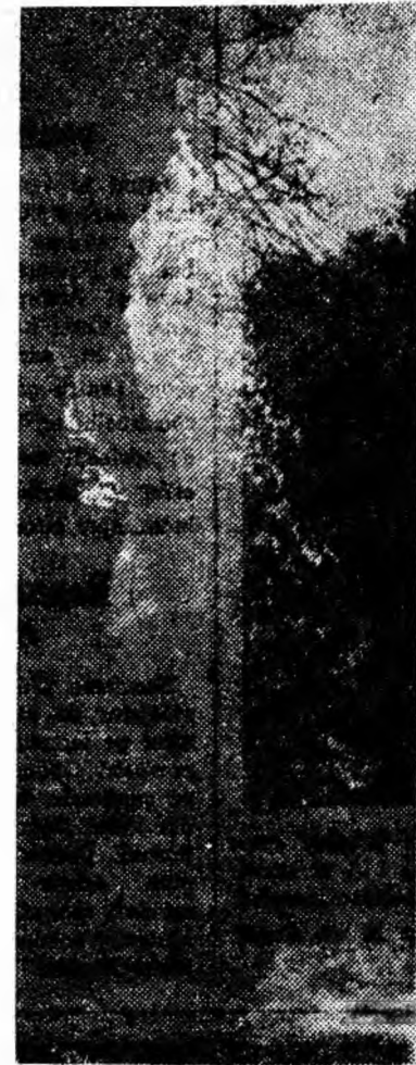
ÎN CILȘEU: Peisaj de toamnă din munții Paring.