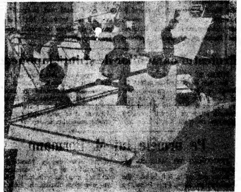
Aici, în această sală de la U.P.D. Petroșani, se nasc proiectele viitoarelor construcții industriale carbonifere.