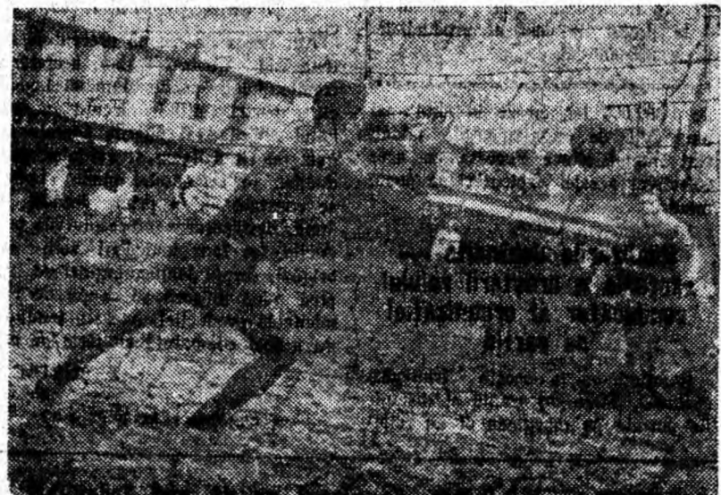
Intervenția portarului e inutilă. Trasă ca din tun, mingea poposește în plasă. Fază din întâlnirea de fotbal dintre Știința Petroșani — Dacia Orăștie.

ALTE REZULTATE: Minerul Vulcan-Textila Sebeș 4-1; Preparatorul Petrila-C.F.R. Simeria 3-0; Refractara Alba-Unirea Hațeg 1-1; Paringul Lo-