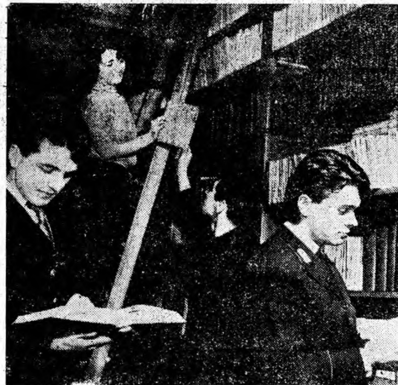
În bibliotecă Institutului de mine Petroșani