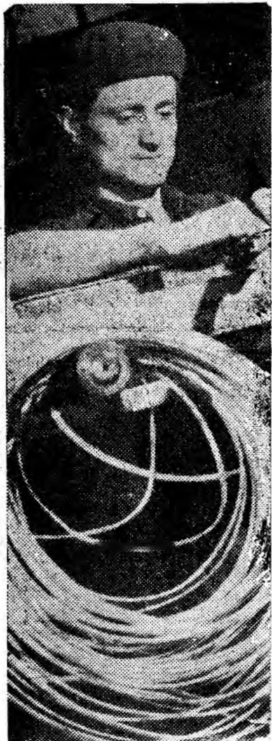
Mișcări sincronizate perfect! Bobinatorul Pop Vasile din secția bobinaj greu a S.R.E. Vulcan bobinează un motor sincron de 456 kW.