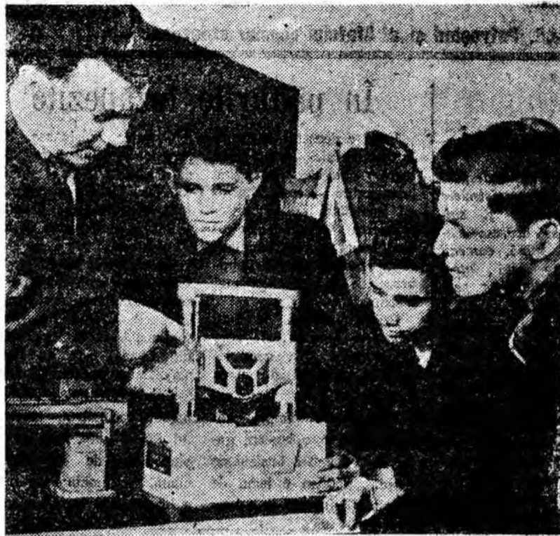
Oră de practică în atelierul de mecanică al școlii.

Am venit pe băncile Școlii tehnice de maștri direct din producție cu dorința de a-mi ridica pregătirea profesională, de a fi mai folositor la locul de muncă. Pentru pregătire avem în școală asigurate toate condițiile. Avem manuale editate special pentru școlile de maștri care redau la un nivel accesibil cunoștințele necesare, avem o bibliotecă ce dispune de numeroase volume de specialitate și cultură generală, avem săli de lectură, ateliere, laboratoare dotate cu scule, instrumente, aparate, machete ale diferitelor utilaje miniere, sisteme de armare a galeriilor, precum și planșe care descompun pe faze dife-