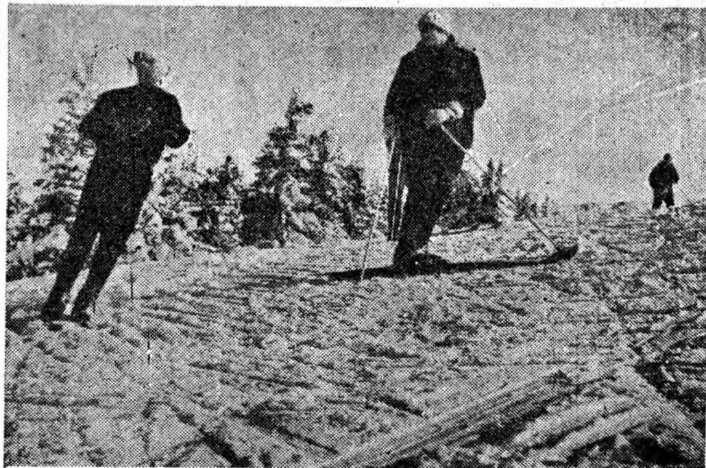
Pe pîrțile de schi din jurul cabanelor din Valea Jiului domnește o vie animație. Și cît de odihnitoare sînt cîteva ore petrecute la munte! În clișeu: Una din pîrțile de pe masivul Paring.