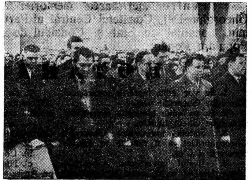
Aspect de la adunarea de doliu din Petroșani.

La sfîrșitul adunării s-a dat citire unei telegrame adresate Comitetului Central al Partidului Muncitoresc Român, Consiliului de Stat și Consiliului de Miniștri ale R.P. Romîne.