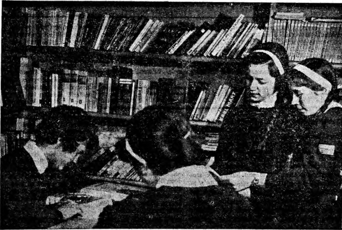
La biblioteca Școlii comerciale din Petroșani.