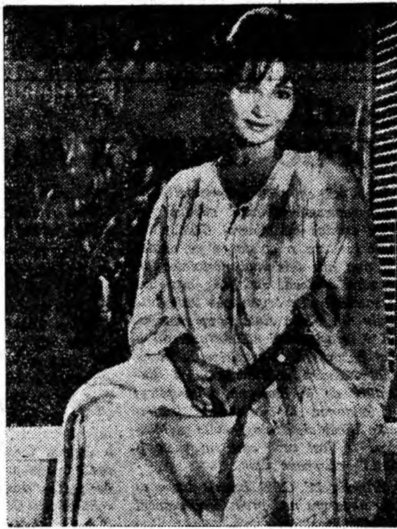
IN CLIȘEU: O secvență din film.

Murad hotărăște atunci să se însoare cu fata care i-a subjugat inima.