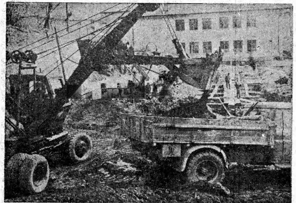
Activitate intensă pe șantierul noului cămin al Școlii profesionale Petroșani.

Activitate intensă se desfășoară și pe șantierele din Petroșani și Lupeni.