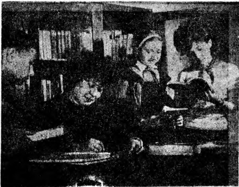
Biblioteca de la Casa pionierilor din Petroșani este vizitată zilnic de numeroși cititori. Fotografia înfățișează un aspect de la bibliotecă. Cîțiva pionieri își aleg volumele preferate.

în premieră pe țară, spectacolul intitulat „Nu prea Albă ca zăpada și Motanul descălțat“ de Al. Popovici. Biletele sînt mise în vânzare la fiecare școală din Petroșani.