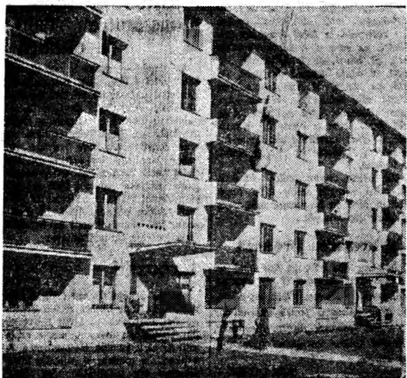
Unul din blocurile date recent în folosință în orașul Vulcan.

Deunăzi construcția podului, în lungime de 96 metri, a fost terminată. Folosindu-se cablu, șine de fier și alte materiale recuperate, la construcția podului s-au obținut economii însemnate.