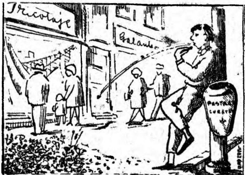
Semințomanul și... opera lui

În fiecare din zilele săptămînit, la București sau în alte localități urbane din țară, ziarele sosesc la chioscuri dis-de dimineață. Mergi la orele 6 sau 7 dimineața, îți vei ziarul la zi, îl citești și ești informat despre evenimentele interne și internaționale. În unele localități din Valea Jiului însă cetățenii nu beneficiază de posibilitatea asta. La Lupeni, Vulcan și Uricani, de pildă, ziarele chiar și cele locale nu pot fi citite decît după ora 10 dimineața. Cu toate că oficiile P.T.T.R. din localitățile sus amintite primesc ziarele locale cu regularitate încă înainte de ora 8, nu le pun imediat la dispoziția chioscurilor și deci a cetățenilor. Curios că această comoditate, de care dau dovadă funcționarii oficiilor P.T.T.R. vizate, este tolerată de organele locale. Oare nu este cazul ca ea să fie curmată neîntîrziat?