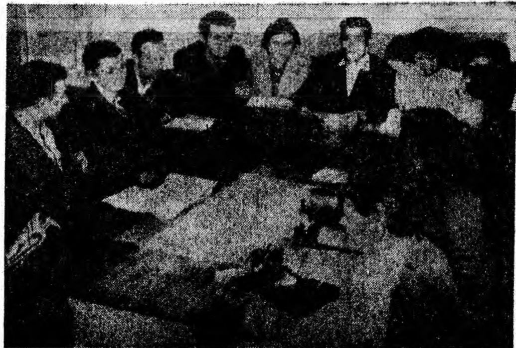
Cursanții cercului de studiere a „Problemelor de bază ale politicii P.M.R.” anul II din sectorul VIII al minei Lonea la convorbirea recapitulative.

era esențial. Prin discuțiile interesante, pline de conținut, cursanții acestui învățămîntului de partid au dovedit că au studiat bibliografia indicată. Rămîne ca și pentru cea de-a doua convorbire recapitulative, care va avea loc în săptămîna viitoare, să se pregătească temeinic și să participe, în număr cit mai mare, la discutarea problemelor.