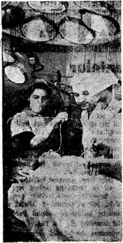
Spitalul Petroșani: Operație.