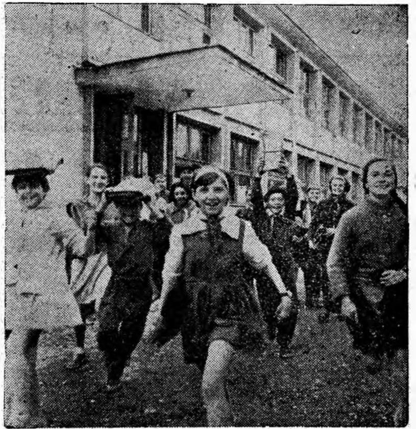
Gata școala! A venit vacanța mare!