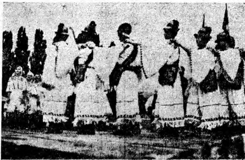
Frunuseșea dansului popular din Oaș a fost prezentată de echipa clubului sindicatului din Lupeni.