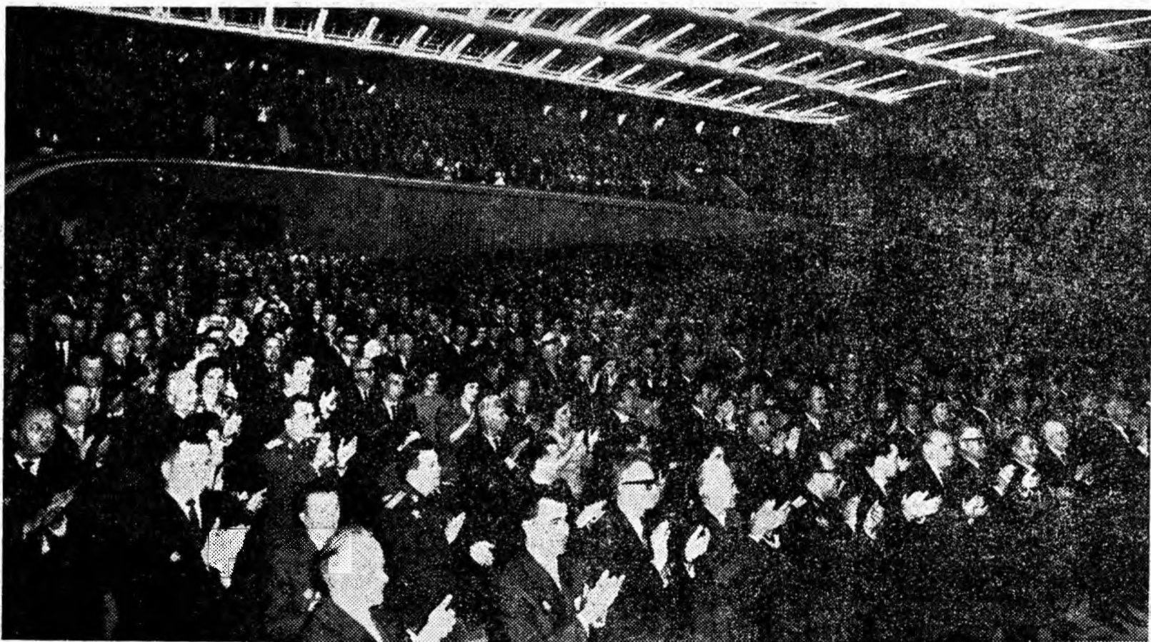
Aspect din sală în timpul deslășuirii lucrărilor Congresului.