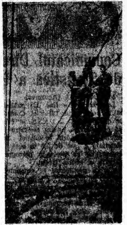
În control pe cablul funicularului.