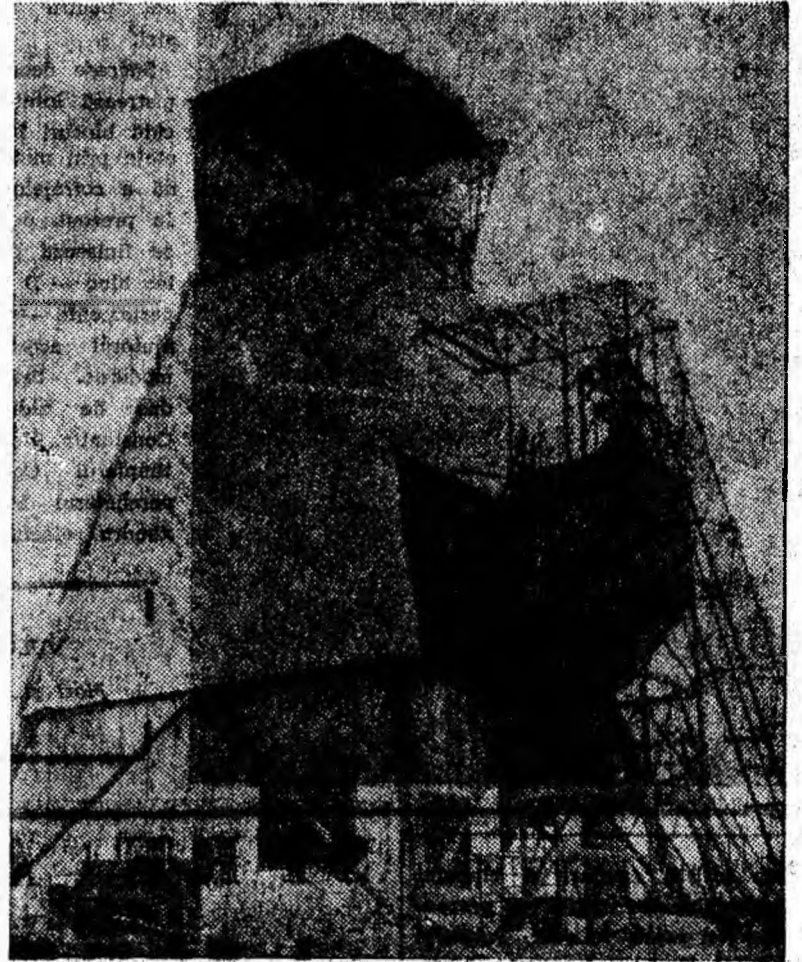
Turnul de săpare al puțului minei Paroșeni.