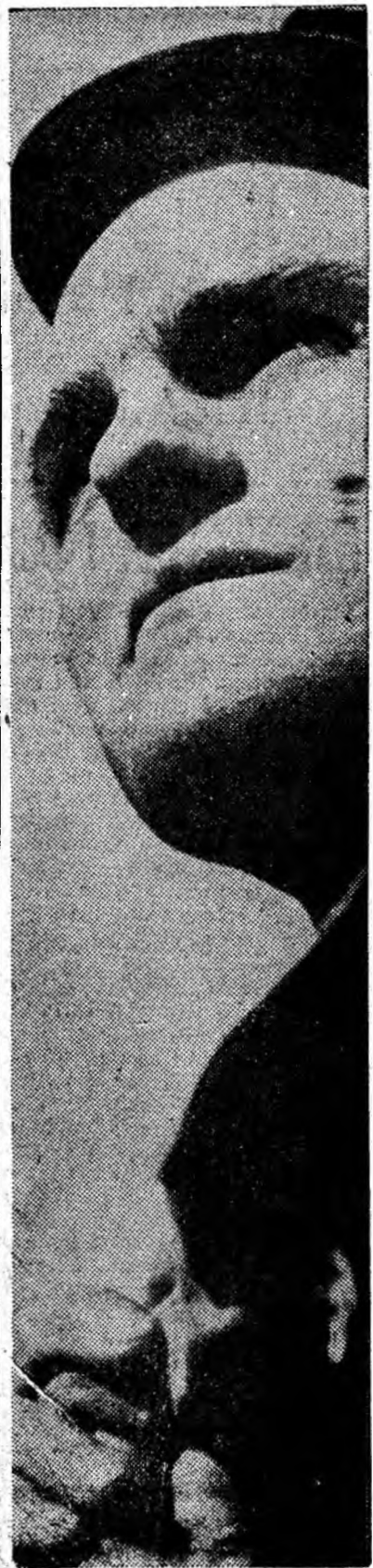
Profil de miner.