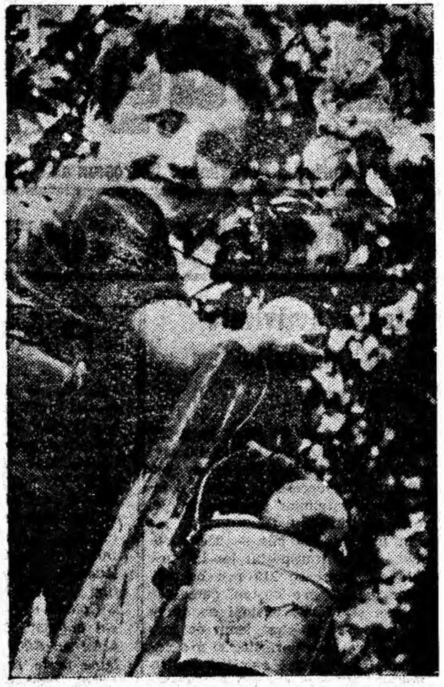
Nu-i așa că merele pe care le culegi singur sint mai gustoase?