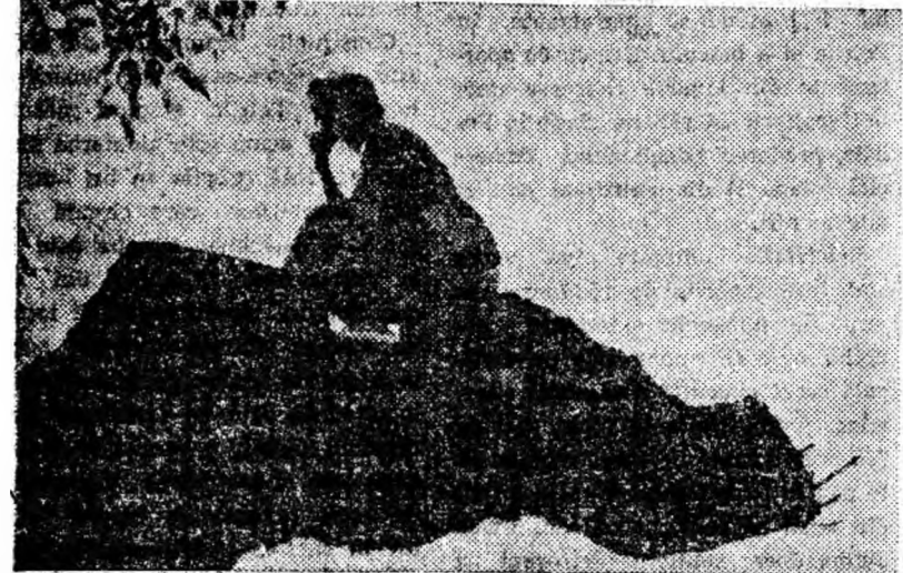
Meditație în amurg de vară tîrzie.