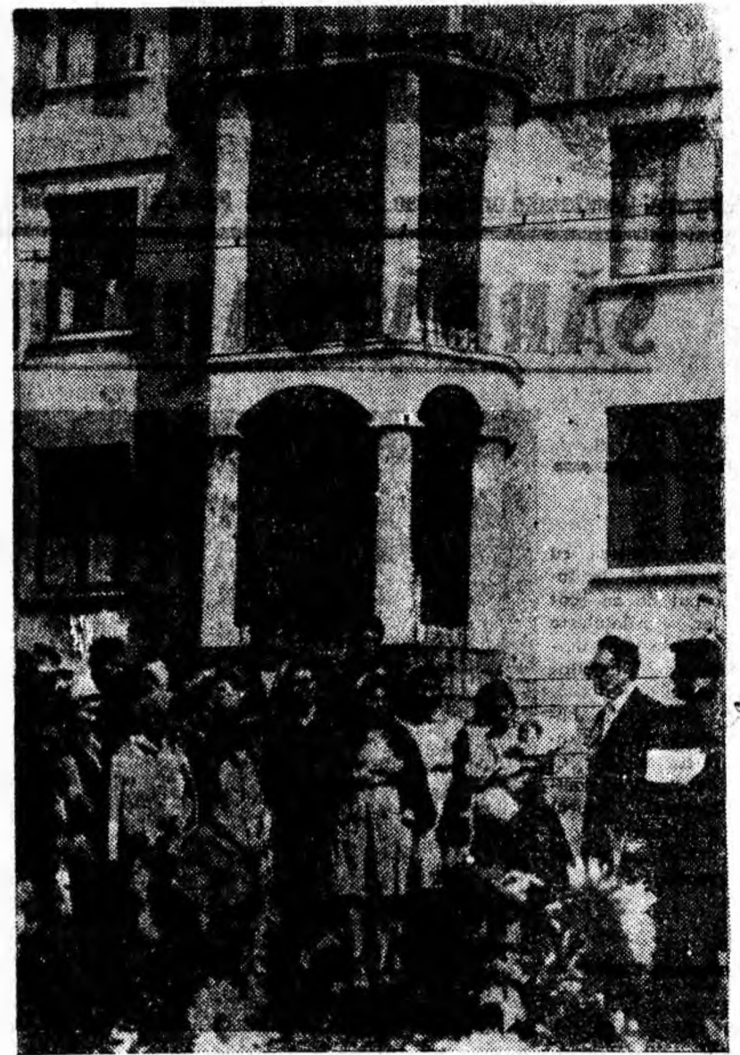
Locatarii clădirii nr. 1 din cartierul „8 Martie” — Petrila (în clișeu) au ales, în cadrul adunării generale ținută recent, comitetul de clădire.

Casa în care locuiesc poartă numărul 12, iar la acțiunile gospodărești sîntem hotărîți să fim printre primii. Cu ajutorul grupei de partid sperăm să și fim. În acest scop comitetul de locatari nou ales, din care fac și eu parte, și-a întocmit un plan concret de activitate, care prevede printre altele, organizarea de acțiuni pentru curățirea dependințelor din subsolul clădirii în care locuim, urmărirea respectării cu strictețe de către gospodine a graficului de curățenie pentru case scărilor și spațiile folosite în comun, a bunei înțelegeri între locatari și achitarea la timp a taxelor, cum sînt chiria, lumina. Intrucît în anumite perioade de timp locatarii de la etajul II duc lipsă de apă din cauza presiunii mici, ne-am propus să luăm legătură cu administrația de blocuri a orașului Uricani, să ne sprijine în rezolvarea acestei probleme acute amenajînd în beci o încăperă dotată cu robinete, de unde să se poată procura apa necesară. Mulțumind celor doi interlocutori pentru răspunsurile date le-am urat activitate spornică în exercitarea atribuțiilor comitetelor de locatari din care fac parte.