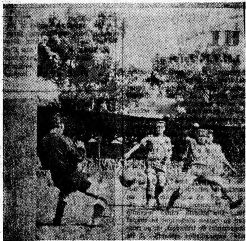
Atac la poarta echipei Minerul Lupeni.