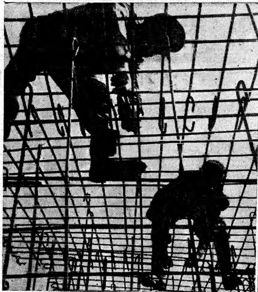
Ei „tes” armătura metalică.