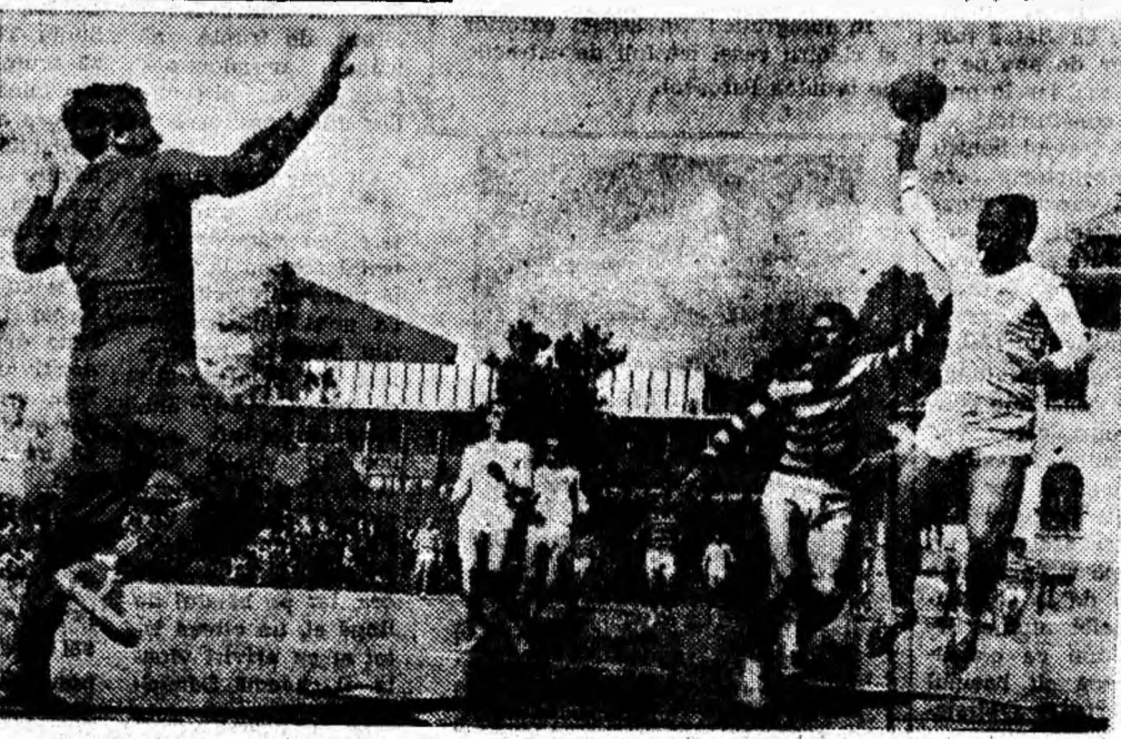
Atac... nereușit la poarta Timișului Lugoj.

Jiul, cu o formație tinăra, de perspectivă, a luptat pentru un rezultat onorabil. Lipsa de experiență a jucătorilor săi și-a spus însă cuvîntul.