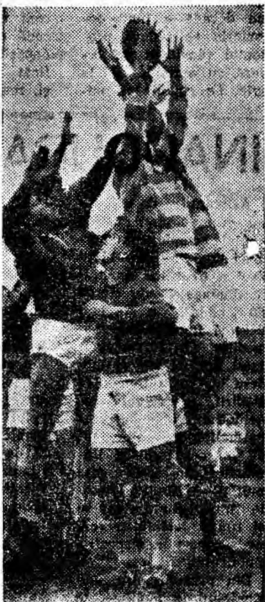
Fază din meciul de rugbi disputat duminică la Petrița între Știința Petroșani — Constructorul București și câștigat de studenți cu scorul de 12-0.