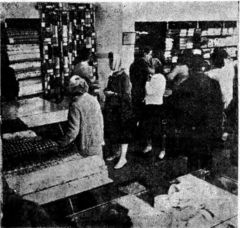
La câteva ore după inaugurare, în magazinul de textile din noul complex comercial al cartierului Livezeni.